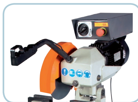
Cabezal giratorio MG-250-CS Swivel head MG-250-CS